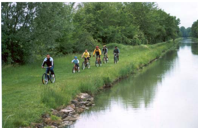
Randonnée VTTiste et VTCiste empruntant le chemin de halage

C'est donc dimanche 4 avril dernier, qu'eut lieu la seconde édition du Canal-VTT, randonnée VTTiste et VTCiste empruntant le chemin de halage du Canal de Berry. Le départ s'effectua de Bourges pour les uns (parcours Jacques Cœur), de Vierzon pour les autres (parcours de la Porcelaine). La rencontre de tous à Mehun (Rencontre CharlesVII) autour d'une table, avec de quoi boire et manger, fut tout à la fois «le temps fort et le moment de réconfort» d'une journée froide et pluvieuse au petit matin, mais relativement ensoleillée dès le milieu de la matinée.