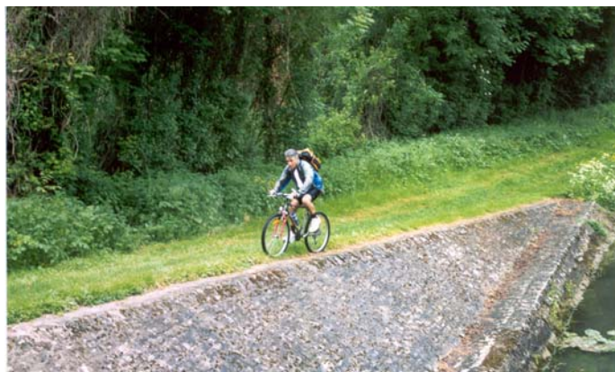
... en terre battue mais sans revêtement asphalté !