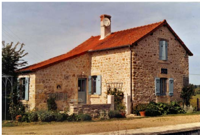
Maison éclusière de la Prée

Bien sûr, vue de l'extérieur, la progression semble plutôt lente ; cependant sur le terrain les difficultés se sont montrées bien réelles. A elles seules, elles pourraient justifier le retard pris par rapport aux prévisions mais après une succession de parcours pas toujours idylliques vient le temps des anecdotes bonnes ou mauvaises et c'est un signe encourageant. Au nombre de celles-ci notons : le franchissement hasardeux d'un passage privé, la confrontation avec un nid de guêpes pas forcément amènes et surtout l'agréable conversation avec une vieille dame charmante empreinte de nostalgie ;